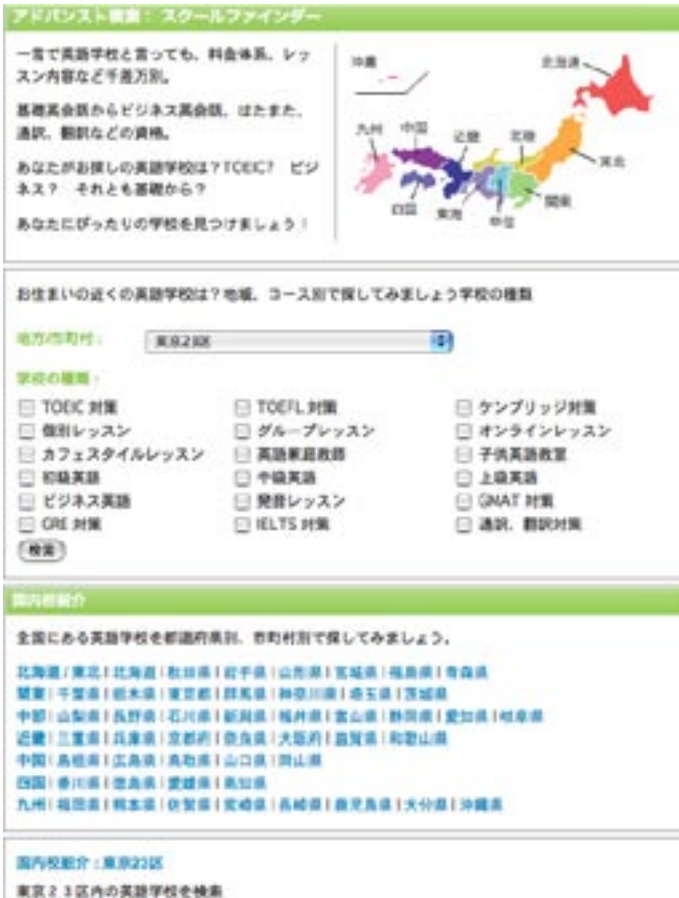
地図と一覧表から英語学校を検索